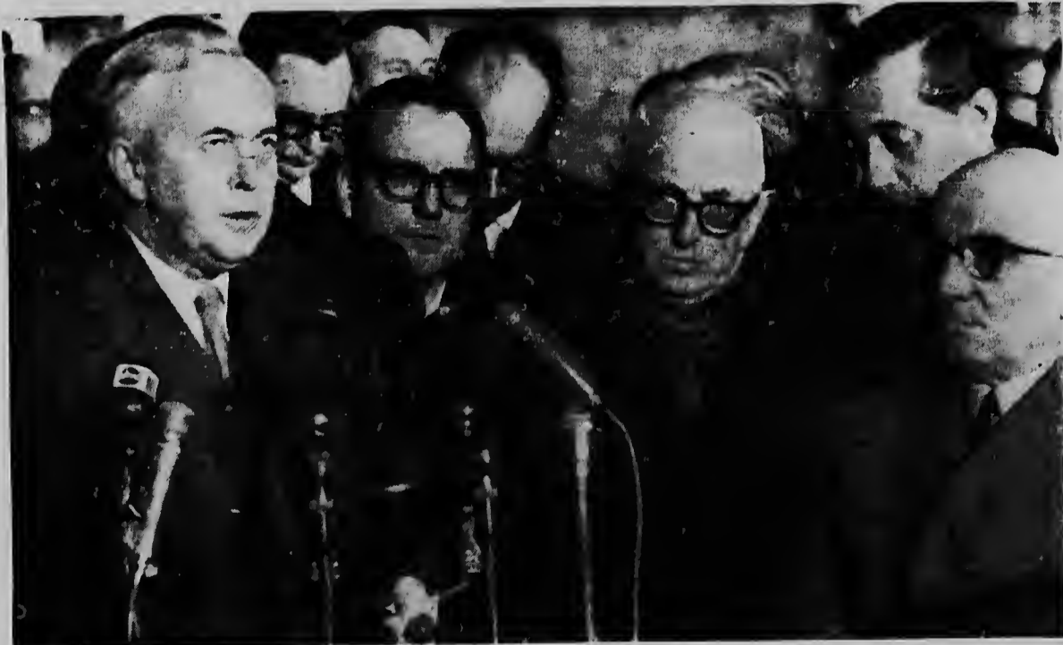
Promer minister Harold Wilson na su yegada na Roma a papia cu periodistanan. Na su man drechi ta e promer minister Italiano Amintore Fanfani y completamente drechi, e vice promer minister Pietro Nenni. Wilson ta na Roma pa papia riba entrada di Inglatera den EEG.